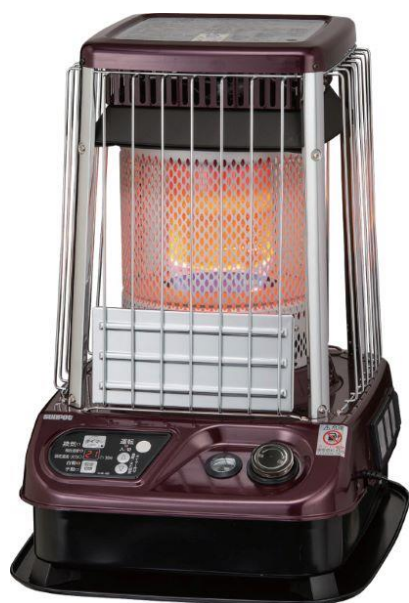
避難所へ提供予定の石油ストーブ KLR-1930A1