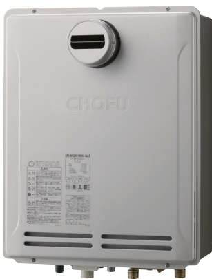
外装色 シャンパンゴールド(防汚鋼板)