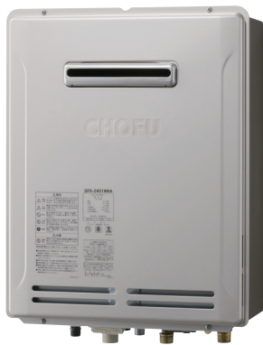
外装色 シャンパンゴールド(防汚鋼板)