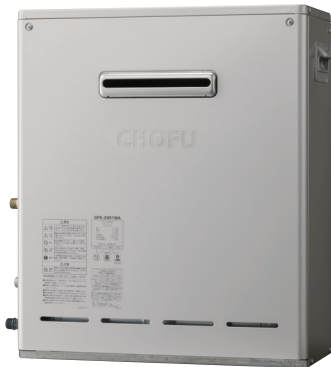
外装色 シャンパンゴールド(防汚鋼板)