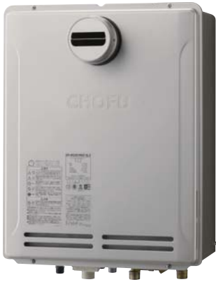
外装色 シャンパンゴールド(防汚鋼板)