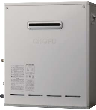
外装色 シャンパンゴールド(防汚鋼板)