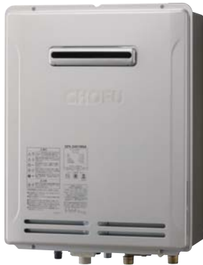
外装色 シャンパンゴールド(防汚鋼板)