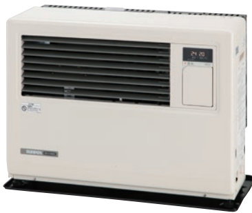
(W)アイボリーホワイト

TKS-TL[774075] 4931643 436276 ¥3,300(税抜¥3,000) FF-4212-3512TLタイプ用