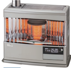
(SG)シルバーグレー 在庫僅少品